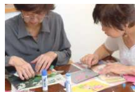
写真と活動内容は上から順に対応しています

先生の衣装は毎回違っており、大変華やかで目を楽しませてくれます。クリスマス会に向け、皆さまもフラダンスの練習に励まれています。エコ手芸は包装容器などの廃物を利用した手芸で、物が生まれ変わる過程を楽しめます。