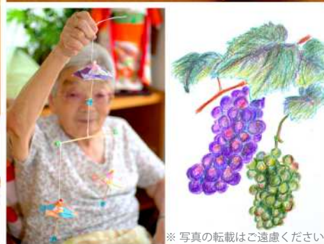
※写真の転載はご遠慮ください。