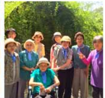
※ 写真の転載はご遠慮ください。