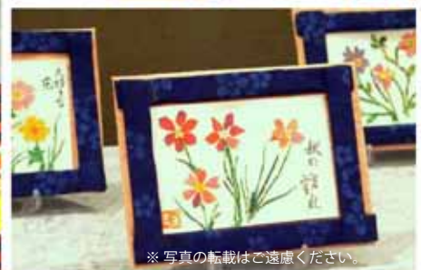
※ 写真の転載はご遠慮ください。