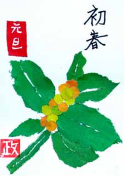
※写真の転載はご遠慮ください。